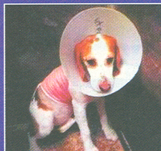
BEAGLE PODCZAS EKSPERYMENTU

U nas parlament próbował uchwalić ustawę zezwalającą na doświadczenia na zwierzętach!